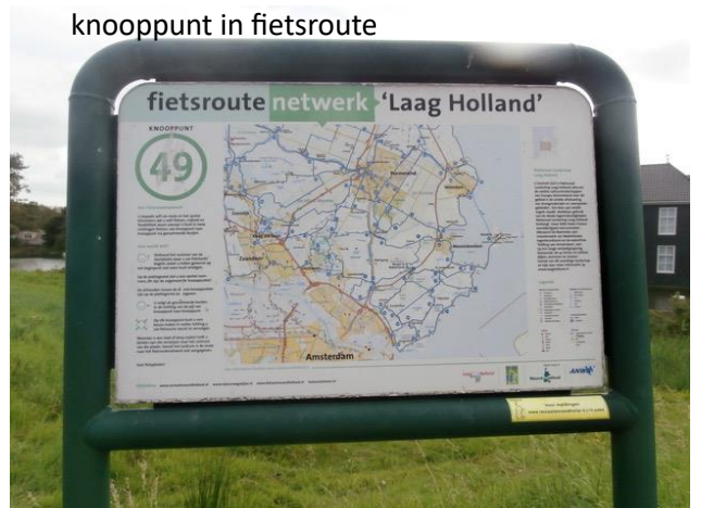
knooppunt in fietsroute