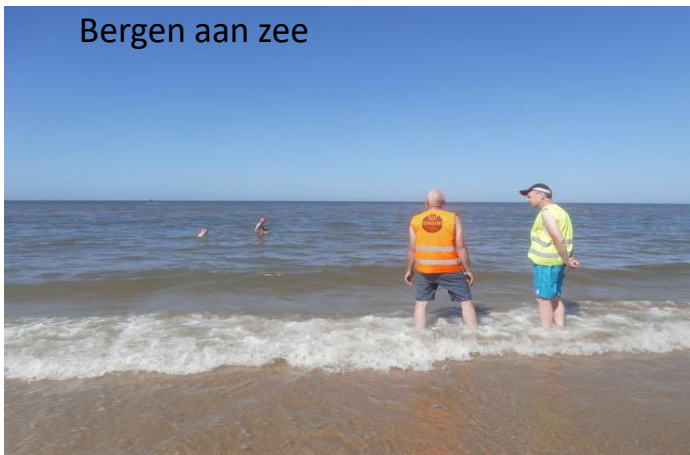
Bergen aan zee