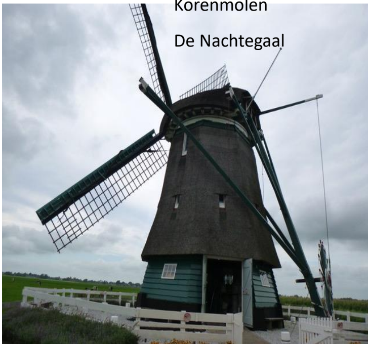
Korenmolen De Nachtegaal