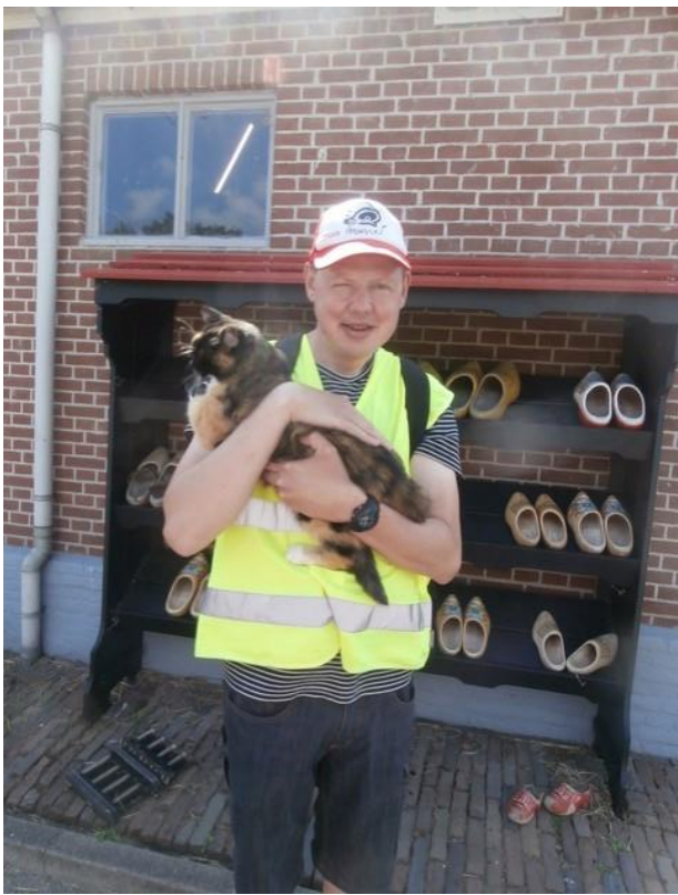
Zaanse Schans 1 e winkel AH