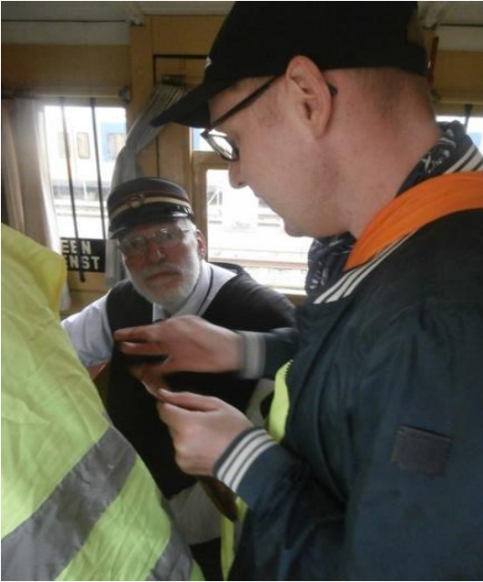
stoomtrein museum Hoorn