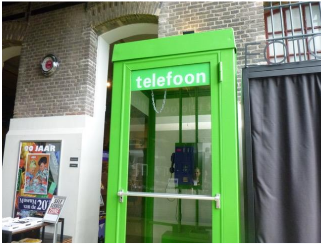
Museum van de 20 ste eeuw in Hoorn