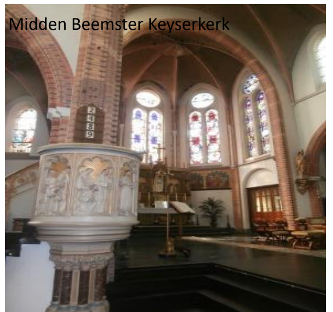
Midden Beemster Keyserkerk