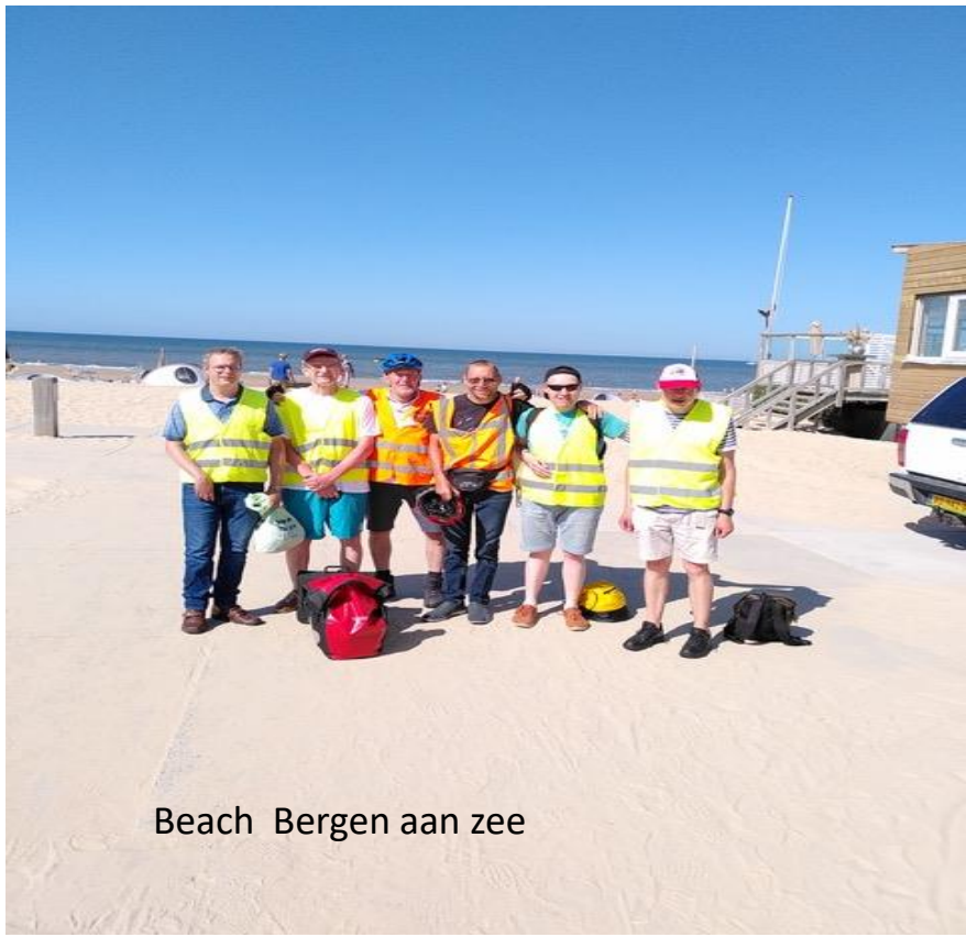
Beach Bergen aan zee