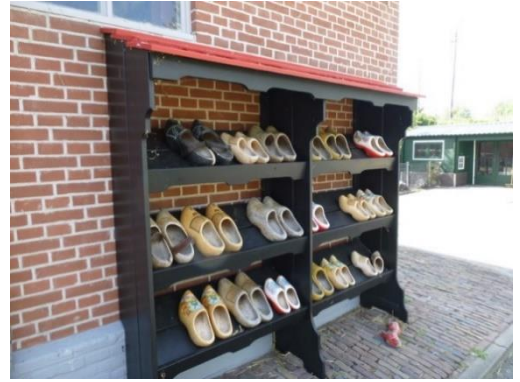
Bergen aan Zee